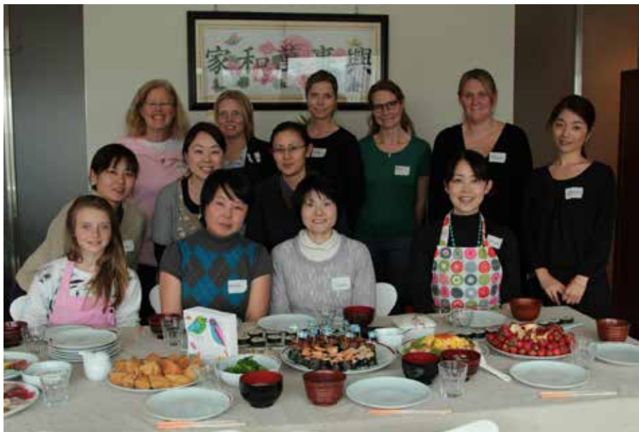
Denna fantastiska förmiddag bjöd på många minnen att bära med sig.

Den 3:e mars varje år firas Hinamatsuri, eller Flickornas dag, i Japan. I år hade vi i SWEA äran att få vara med och fira denna högtid tillsammans med våra SWEA-Tomodachis.