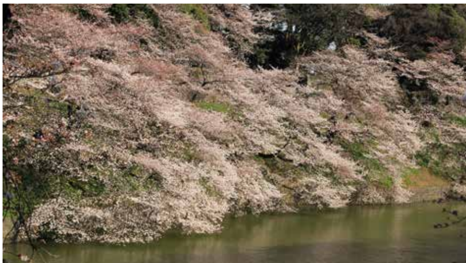
Sakurablomning i Shinjuku Gyoen.

Var finns de vackraste platserna för att se körsbärträden blomma? Kathleen Paulsson inspirerar till sakura-promenader med sina bästa tips.