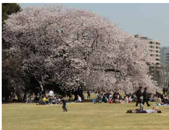
Shinjuku Gyoen blomstrar

Under mars månad väntade vi otåligt på att vintern skall släppa greppet och nu kan vi äntligen börja njuta av solen, värmen och den prunkande växtligheten.