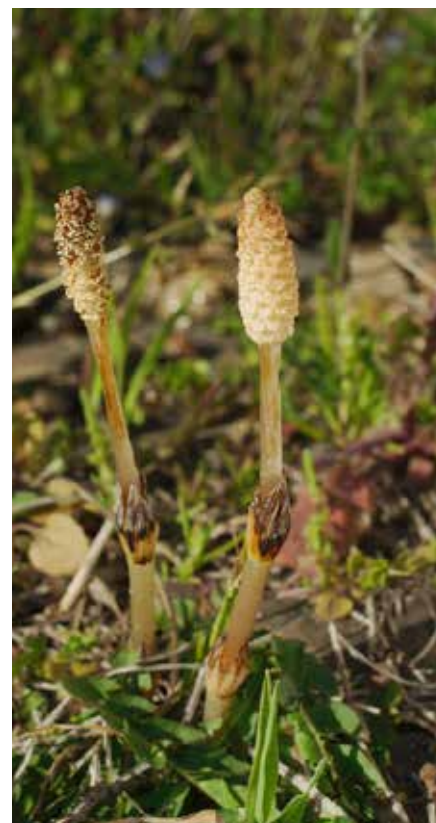
Tsukushi (sv. åkerfräken) – Ogräs eller delikatess?

Tsukushi, eller åkerfräken som växten heter på svenska, finner du fritt förekommande runt om i Japan under våren. I Sverige kan den användas som medicinalväxt och är också betraktad som ogräs men i Japan kan man tillaga och äta den. Skotten som används i matlagning liknar sparris och de något torra bladen längs stälken plockas bort innan de tillreds. Ett förslag på tillredning är att koka skotten i 10-15 min och därefter vända ner de i en sojadressing gjort på soja, saké, socker och dashi-buljong. Låt det sjuda i några minuter. Ät dem som de är eller lägg tsukushin över ris. Kanske hittar ni tsukushi på någon utflykt, plocka då med er och prova att tillaga!