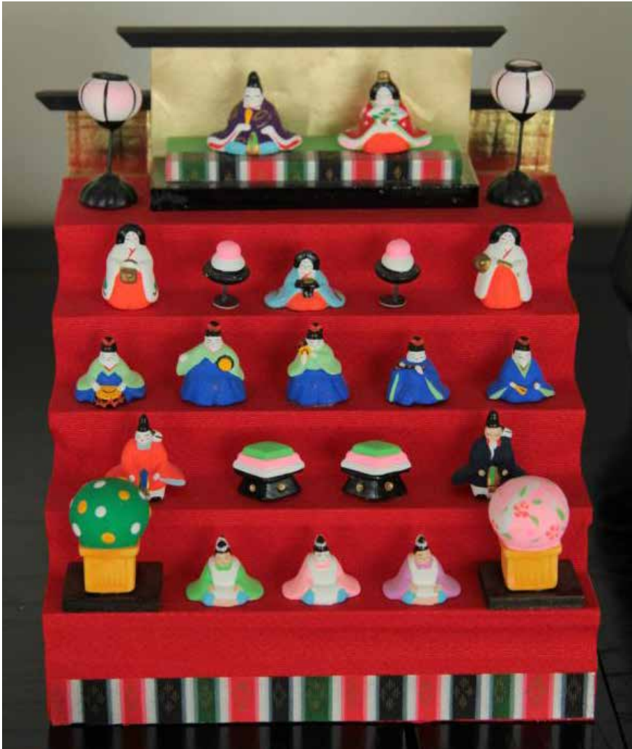
Traditionellt sätt Hina-ningyo-dockorna upp i nivåer.

Hinamatsuri firar man varje år den 3:e mars i Japan. Det översätts oftast som Flickornas dag, men den direkta översättningen är egentligen ”dockfestival”. Varje hushåll med flickor har ett set med dockorna som kallas ”Hina-ningyo”. Dockorna representerar kejsaren och kejsarinnan och är uppklädda i traditionella hovdräkter från Heian eran (794 - 1192), vilket var en elegant epok med adelsfamiljer vid makten. Kejsarfamiljen klär fortfarande upp sig på sådant sätt när de gifter sig. Dockorna börjar visas upp under februari månad och tas undan direkt efter festivalen. Brådskan med att plocka undan dockorna är för att man tror att dottern annars kommer få oturen att gifta sig sent i livet. Under dagen äter man bl.a. chirashi zushi, musselsoppa, och hina arare, samt pryder med persikoblom-