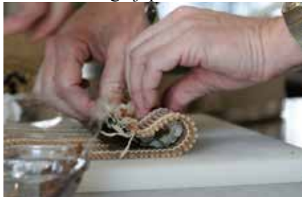
En Hosomaki Zushi rullas ihop.

Det bästa är ju självklart att vi får lära oss laga japansk mat men