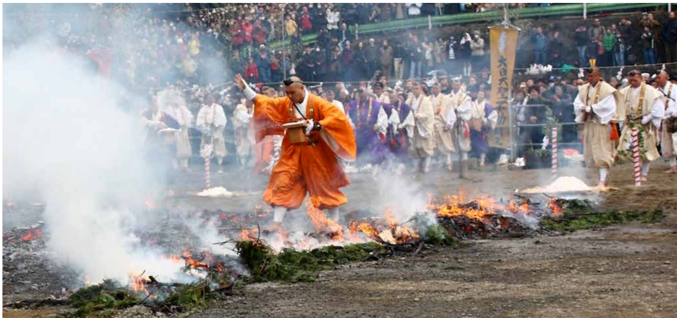
Munkarna går barfota över glöden när de ber.