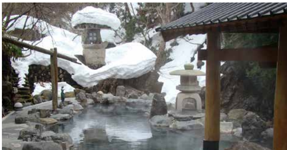
Ett av utomhusbaden vid Osenkaku ryokan.

Om du vill resa iväg en helg till ett fint rusikt ryokan beläget vid en härlig flod-onsen ska du åka till Taragawa Onsen i närheten av Minakami i Gunma prefecture. Enklast är att ta sig hit med bil, ett par timmar från Tokyo.