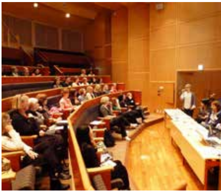
Adela delger årsmötet fakta om våra medlemmar.

SWEA Japans årsmöte 2013 började med kaffe och ordförandes hembakade kanelbullar i Svenska Ambassadens foajé. Ungefär ett fyrtiotal SWEOR var på plats, denna blåsiga men soliga februari-morgon.