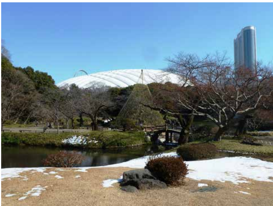
Koishikawa Korakoen i januari

och Sveriges Ambassad i syfte att få ett bredare nätverk och därmed större möjlighet att arrangera gemensamma, trevliga evenemang.