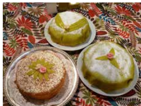
De tre färdiga prinsesstårterna