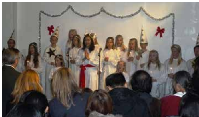
Luciatåget spred en härlig julstämning inne på ambassaden.