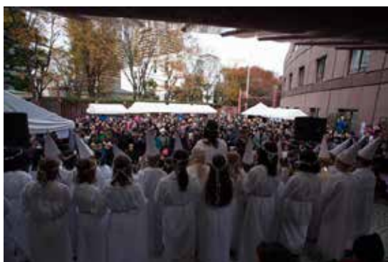
Luciatåget på scenen där eleverna från Svenska skolan sjöng inför en uppskattande publik.