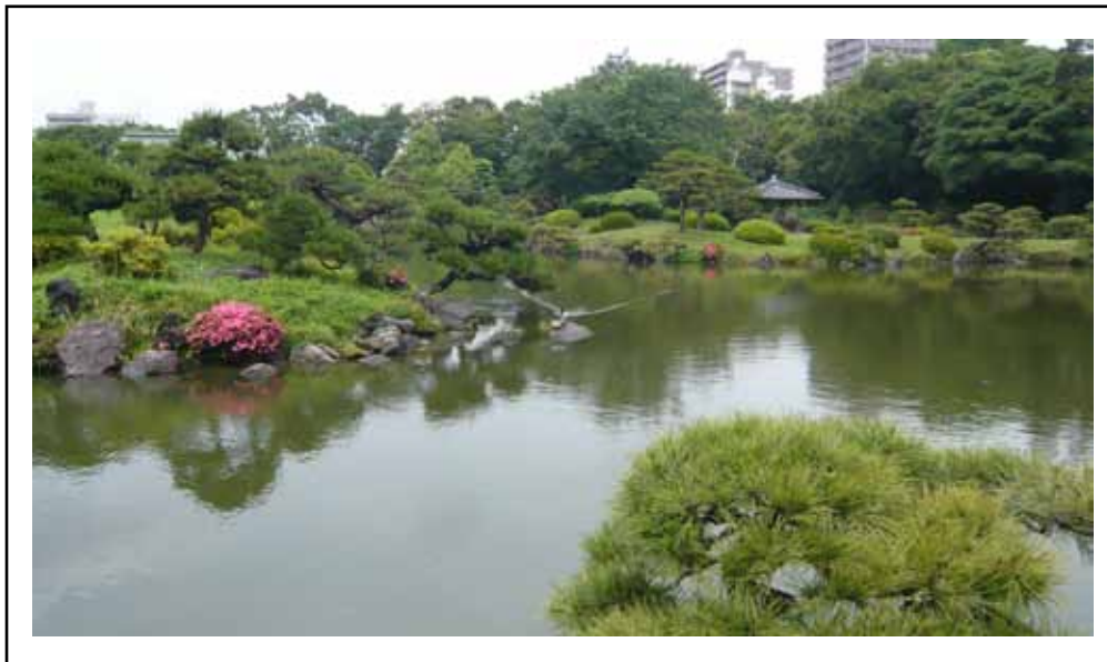
Fridfullt. Kiyosumi Teien Garden - mer känd som stenträdgård med sina olika stensorter som Iwasakifamiljen samlat på sig från hela Japan.

Text: Olivia Sesevic Juni 2009