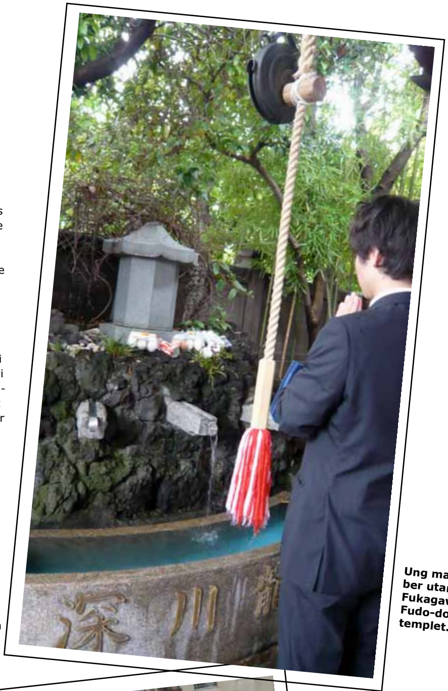
Ung man som ber utanför Fukagawa Fudo-do templet.