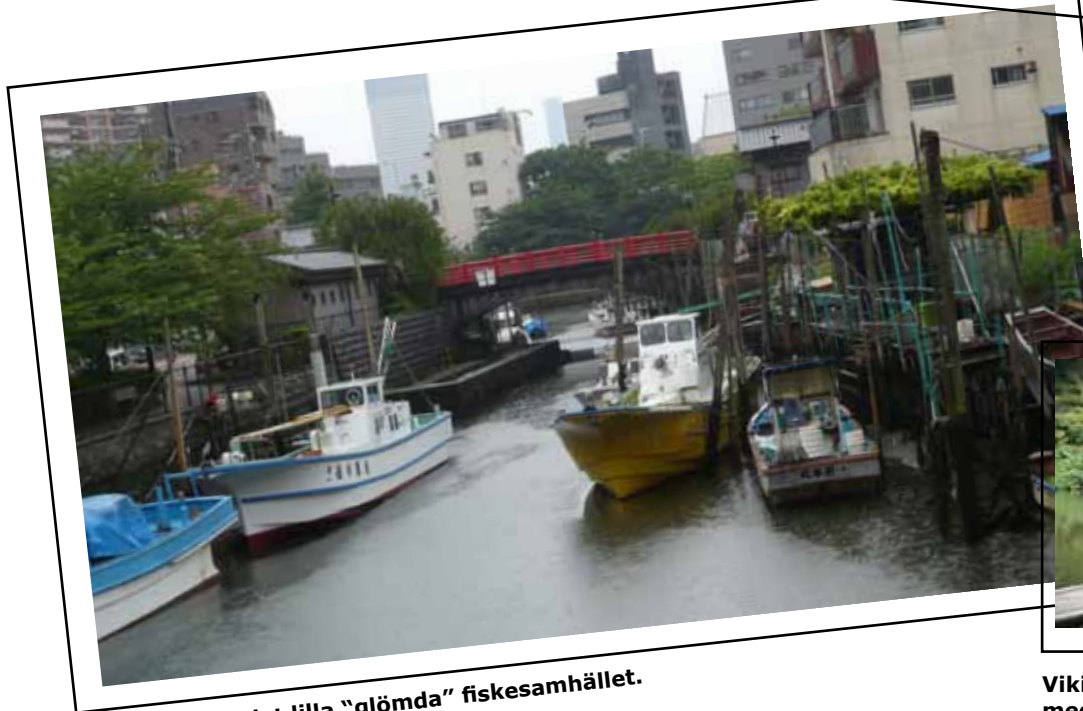
Tsukudajima, det lilla "glömda" fiskesamhället.