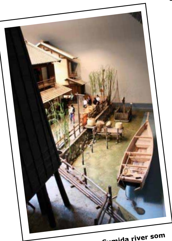
En promenad längs Sumida river som det begav sig under Edo-perioden.